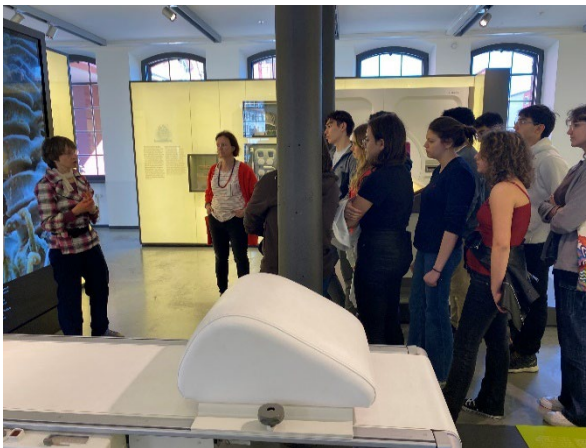
Erlangen, "Siemens Museum"