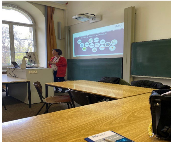
Erlangen , Friedrich-Alexander Universität

Danach haben wir den Botanischen Garten und den Campus besichtigt und auf dem Mensaplatz zu Mittagessen gegessen. Anschließend haben wir eine Führung durch das MedMuseum von Siemens Healthineers zum Thema „Von Röntgengeräten, Hörbrillen und Zahnschlüsseln“ gemacht. Wir hatten auch eine Museumsführerin, die uns durch das Museum führte.